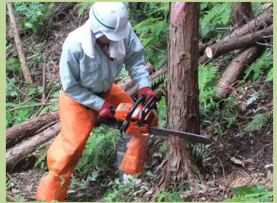
伐倒講習：受口づくりの状況